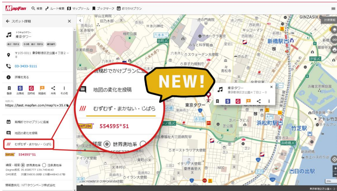
<パソコンでの利用イメージ：東京タワーの場合>

注 1：著作権者の許可なく業務目的の地図の印刷・複製は著作権法により禁止されています。