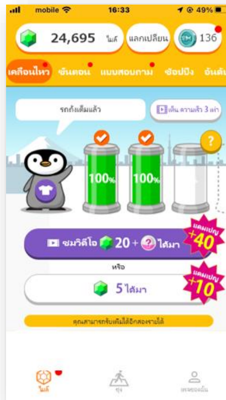
【ローカル言語のトリマ イメージ図】

世界のユーザーが喜ぶサービスをつくり、トリマを世界的なサービスにするべく、短いスパンでサービスの改善を行い続け、海外で日本発のアプリでの成功をさせていきたいと考えています。アプリを各国でローンチさせた後に、日本でも展開しているトリマクーポン、トリマリサーチといった、トリマを軸としたサービスの提供も順次開始していく予定です。