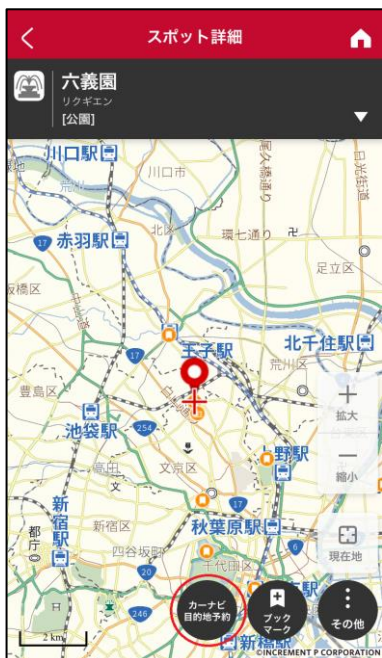
【アプリ】カーナビ目的地予約