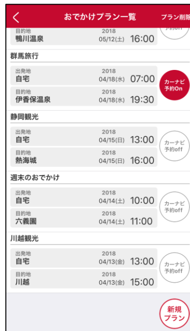
【アプリ】おでかけプランカーナビ転送予約